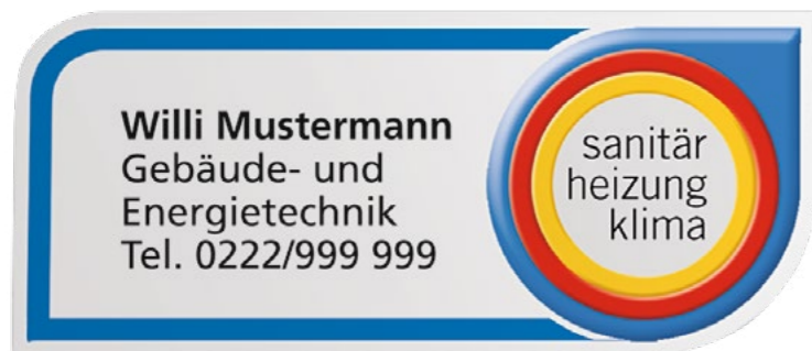
Motiv Auto- und Firmenaufkleber